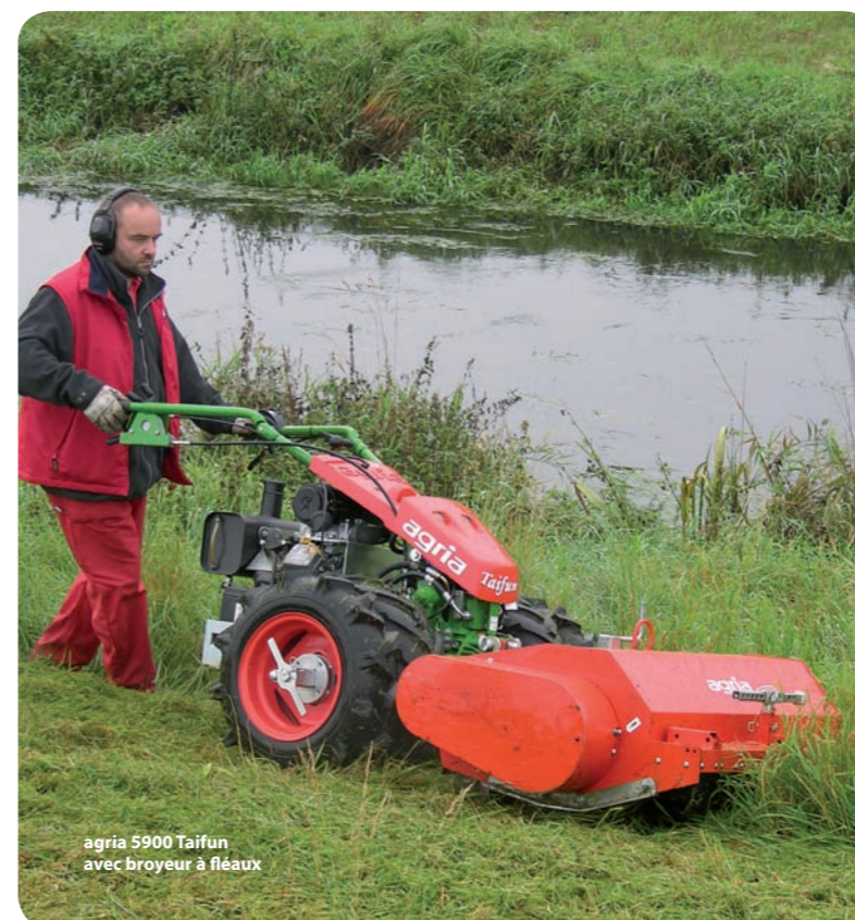
agria 5900 Taifun avec broyeur à fléaux

Pour obtenir le prix veuillez contacter votre revendeur agria régional ou nous sales@agria.de