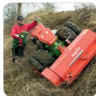
agria 5900 avec débroussailluse à fléaux et pneus jumelés en pente

Essieu déportable: pour un transfert du centre de gravité (option)